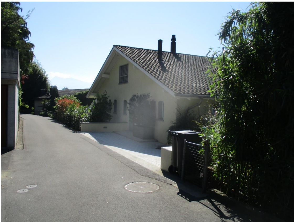
Accès à la villa des WIPRÄCHTIGER au nord