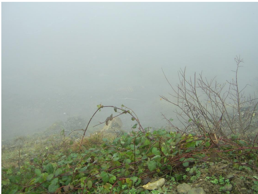
Le Giessbach, un jour de brouillard du mois de novembre, photographié du haut de la propriété de Peter OTT