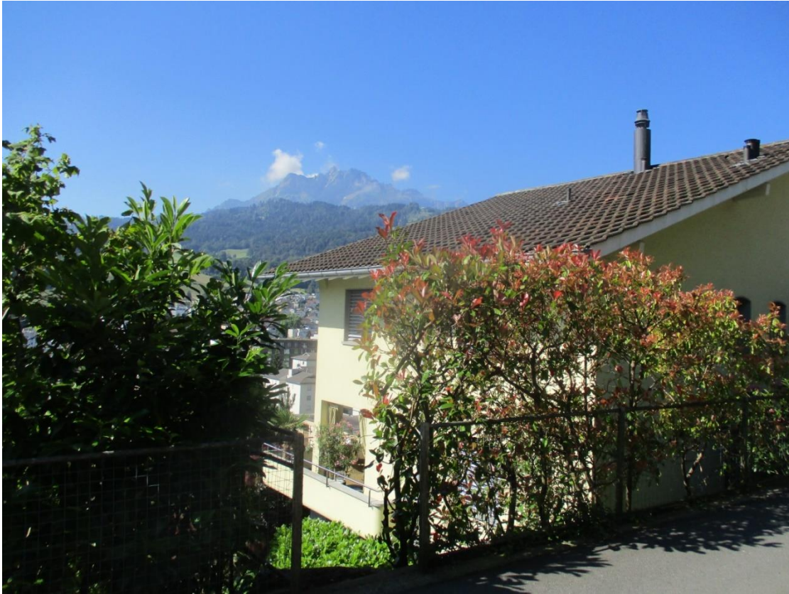
La maison vue du nord-est avec vue sur le Pilatus